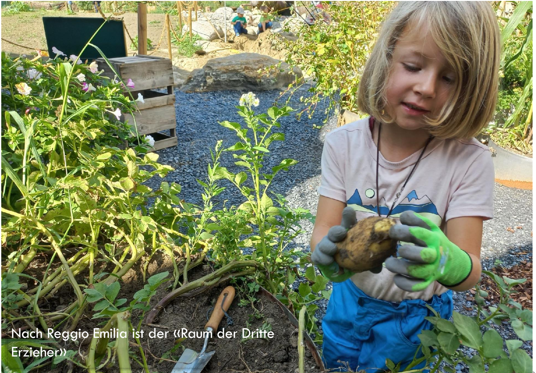
Nach Reggio Emilia ist der «Raum der Dritte Erzieher»